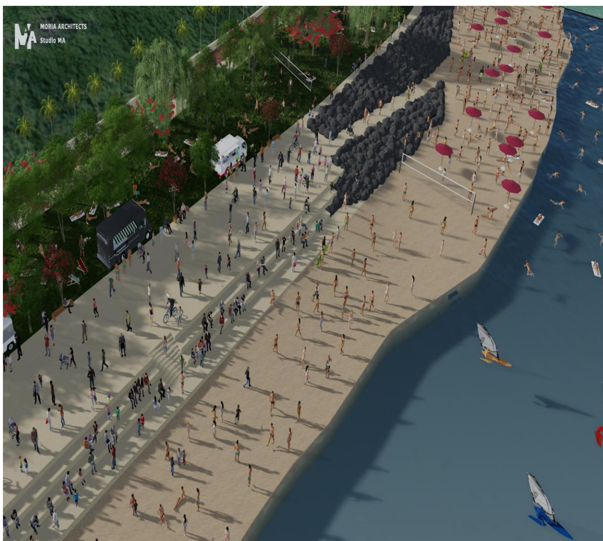
טיילת הדקל של ב (הדמיה מוריה אדריכלים)