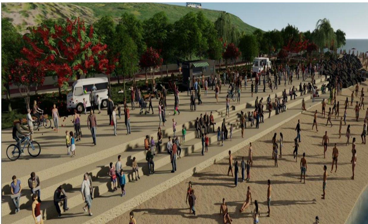
טיילת הדקל של ב (הדמיה מוריה אדריכלים)