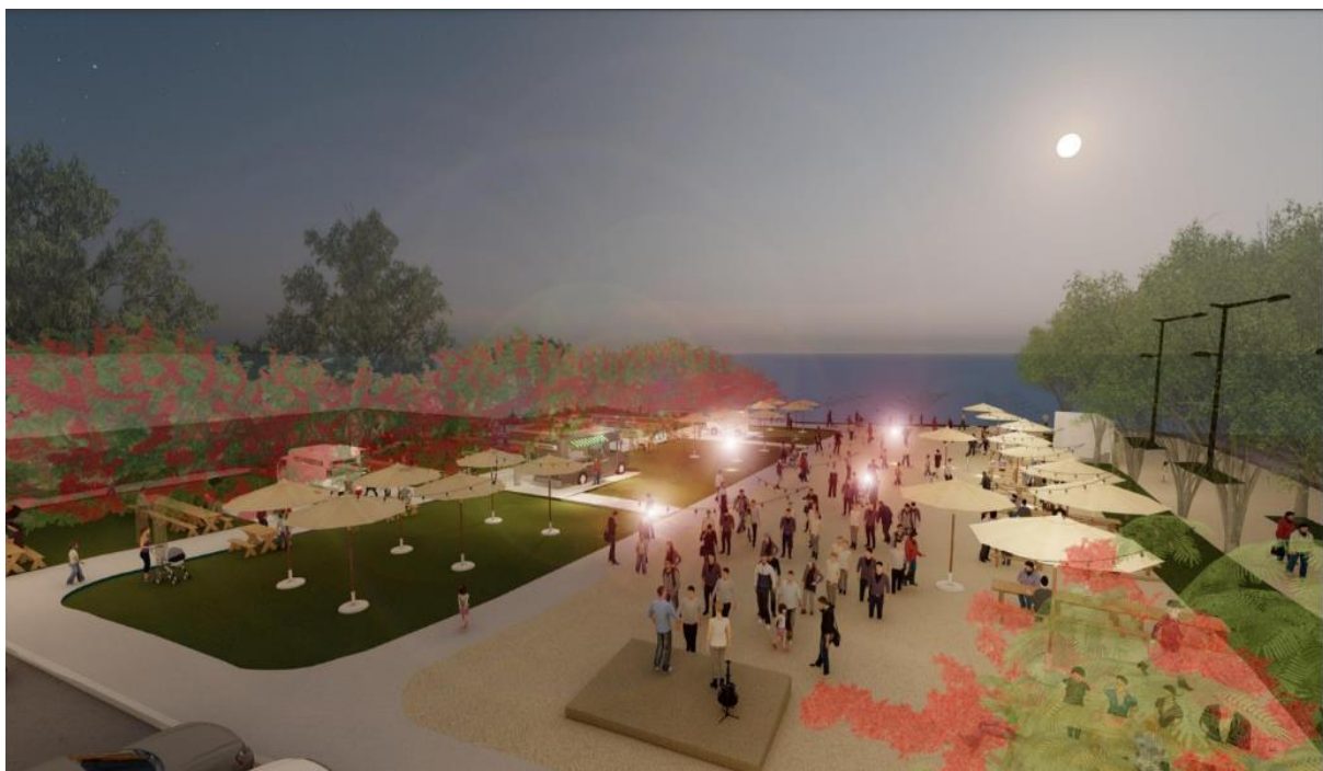
מעגן הדיג ( הדמיה מוריה אדריכלים )